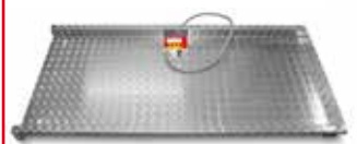
Wiegeplattform für 200er Kuhbetrieb an der Kraftfutterstation