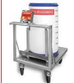
Fasswaage für chemische Industrie