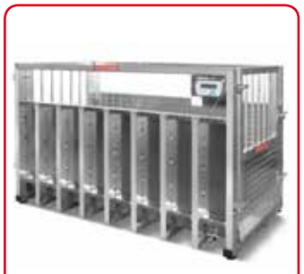
Bullenwaage für Exportverwiegung im Hamburger Hafen