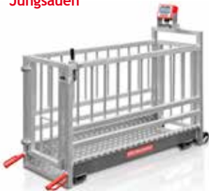
Selektionswaage für Jungsaunen

Außenmaß LxBxH (m): 1,75 x 0,58 x 1,10 Innenmaß LxBxH (m): 1,42 x 0,47 x 0,90