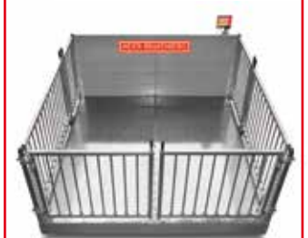
Drei-Wege-Kreuzung an Verladerampe