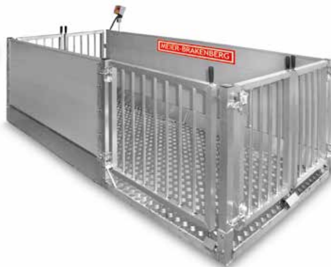
Stationäre Waage mit zusätzlichem Seitentor