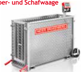
Kälber- und Schafwaage

Außen LxBxH (m): 1,50 x 0,76 x 1,10 Innen LxBxH (m): 1,22 x 0,47 x 0,90