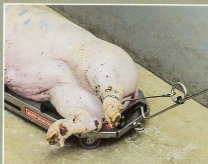
Nach dem Aufnehmen des Tiers mit der Fangschlaufe lässt es sich damit im Nu auch gleich abtransportieren.

Mit der Kadaverkarre Transporker stellt Meier-Brakenberg nun eine weitere Kadaverkarre vor, diesmal eine Variante für den